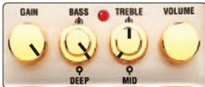
GRUNGE / HARDCORE (Усилитель: чистый звук)