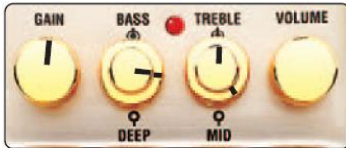
FAT BLUES (Усилитель: чистый звук)