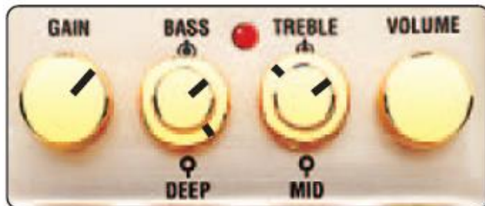
CRUNCH (Усилитель: чистый звук)