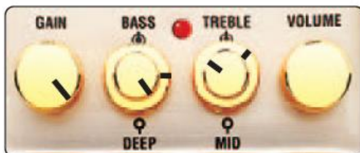
SCREAMING SOLO (Усилитель: чистый звук)